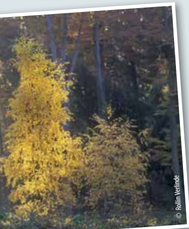
Het Zwaenepoelreservaat door de ogen van Rollin.