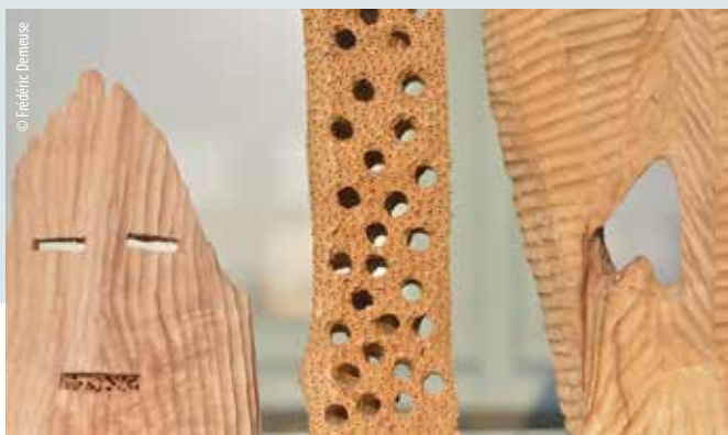
Van links naar rechts: Masque chamannique , Empire State Building , Femme et Homme .