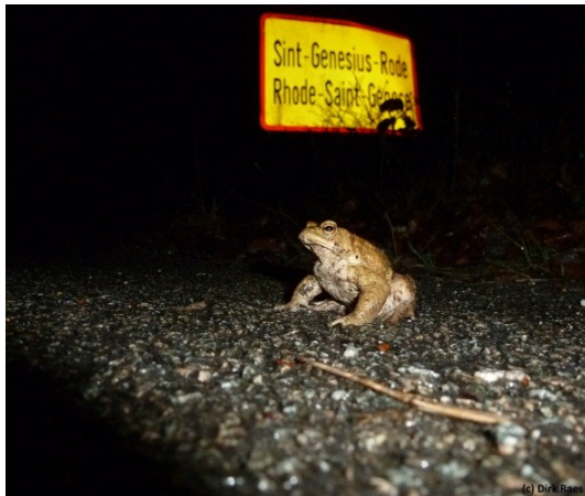
Wachten op de oversteek