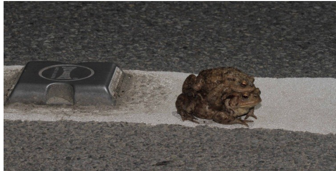
Samen de witte lijn durven oversteken