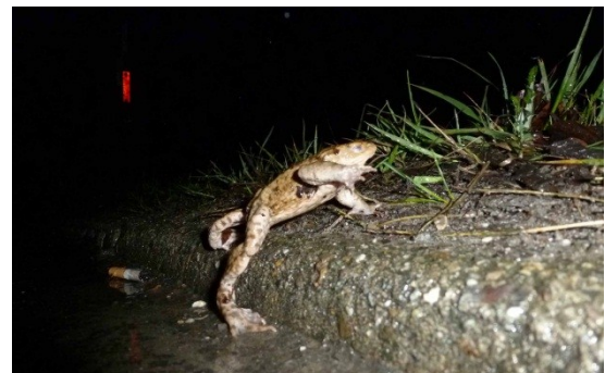
lage boordsteen nabij de parking en t.o.v. de Lindenvijver.