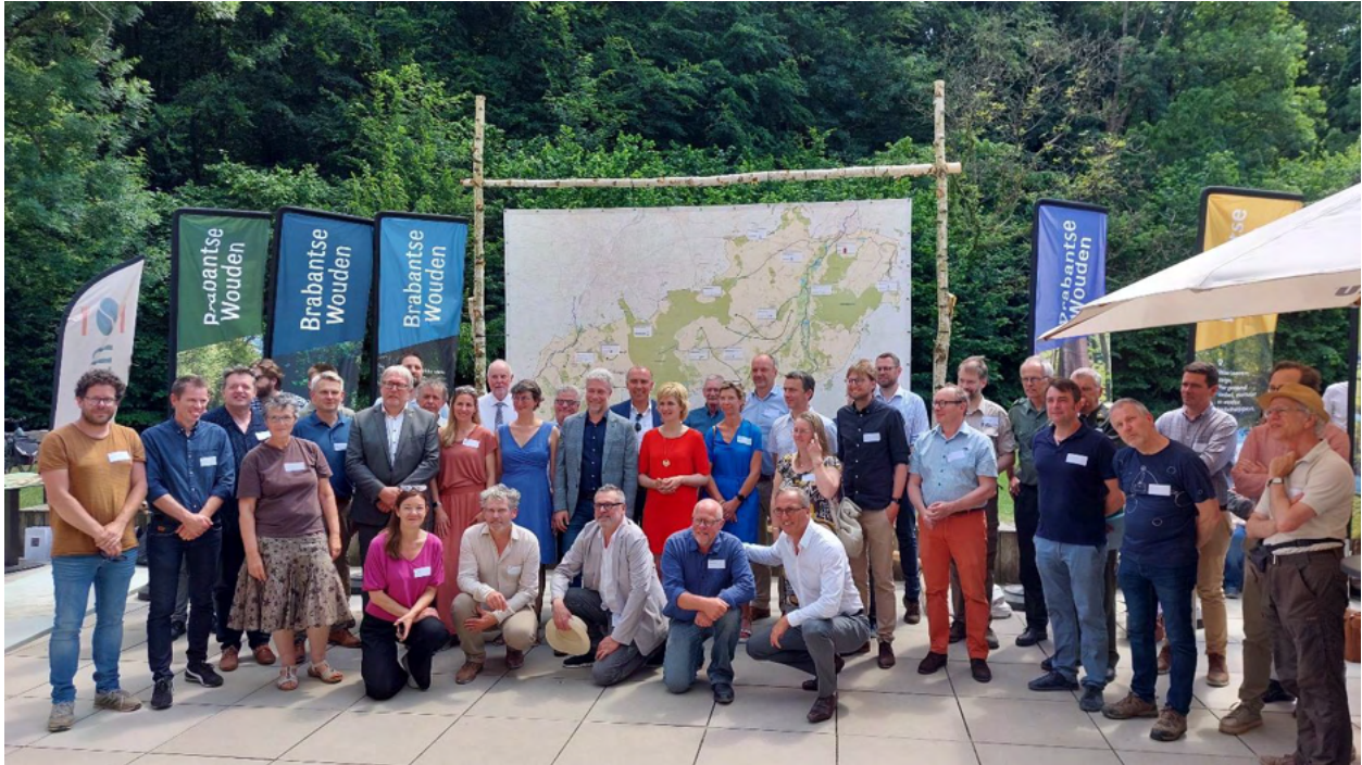
Groepsfoto met de ministers, de gedeputeerden van de provincies, bosbeheerders en de verschillende partners uit de drie gewesten.

7 juni 2023 – Zoniënwoud, in het hart van de Brabantse Wouden